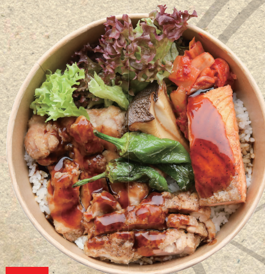
M6 鉄板焼照焼チキンサーモン丼 Teriyaki Chicken Salmon Don Hähnchen Teriyaki und Lachs vom Grill auf Reis