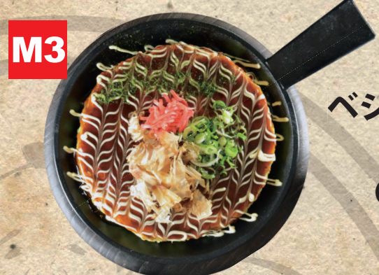
M3 ベジお好み焼き mit Gemüse 12.50€