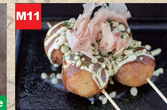
M11 鉄板たこ焼き串 TAKOYAKI (frittierte Teigkugeln mit Oktopusstückchen)