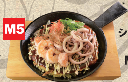
M5 シーフードお好み焼き mit Meeresfrüchten 19.50€