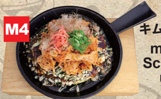
M4 キムチ豚お好み焼き mit Spitzkohl, Schweinefleisch und Kimchi 15.50€