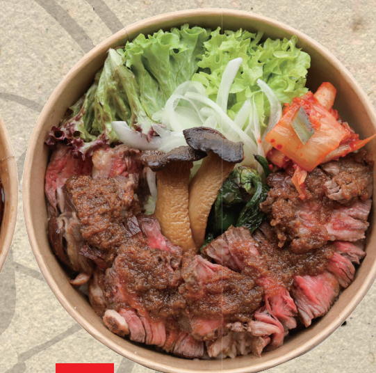
M8 鉄板焼牛ステーキ丼 Steak Don Rindersteak mit Steaksoße nach japanischer Art auf Reis