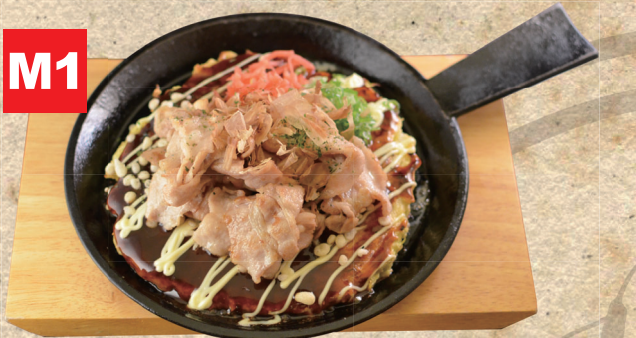
M1 豚お好み焼き 13.50€ mit Spitzkohl und Schweinefleisch

み焼き ※全てのお好み焼きには魚出汁を使用しています Für den Pfannkuchenteig wird Fischbrühe verwendet