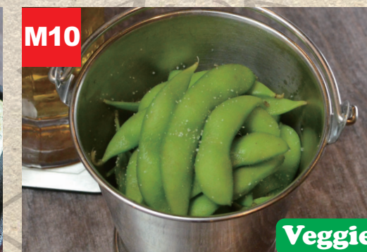
M10 枝豆 EDAMAME (Gekochte Sojabohnen) Veggie