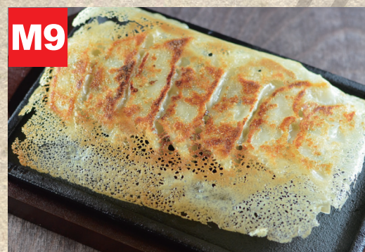
M9 羽根つき一口ギョーザ GYOZA (Hähnchenfleisch & Gemüse)