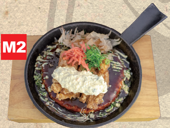
M2 南蛮タルタルお好み焼き mit frittiertem Hähnchen 15.50€ und japanischer Remoulade