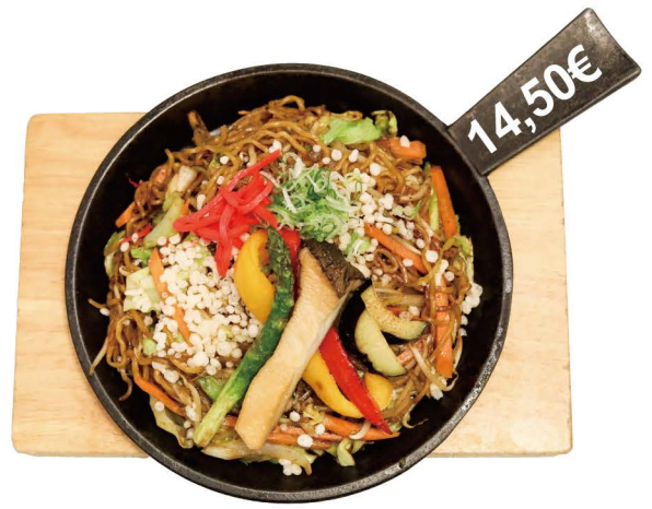
ベジ鉄板焼きそば Veggie Yakisoba / Vegan Yakisoba Gebratene Nudeln mit Gemüse