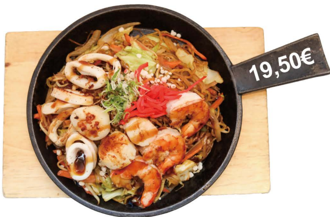
豪華海鮮鉄板焼きそば Meeresfrüchte Yakisoba Gebratene Nudeln mit Garnelen, Jakobsmuscheln und Tintenfisch