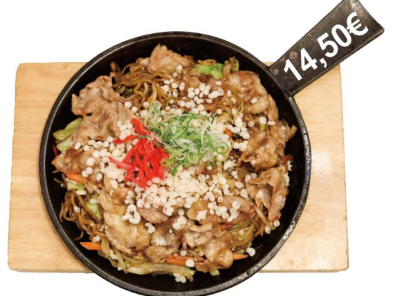
豚鉄板焼きそば Buta Yakisoba Gebratene Nudeln mit Schweinebauchscheiben