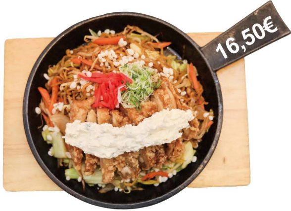
南蛮タルタル焼きそば Nanban Tartar Yakisoba Gebratene Nudeln mit knusprigem Hähnchen und hausgemachter Remoulade