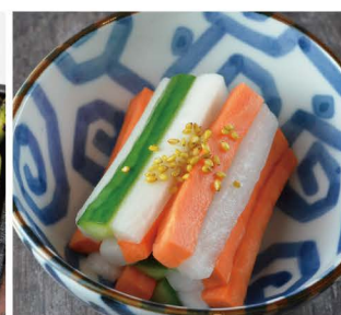
YASAI no YUZUSU ZUKE