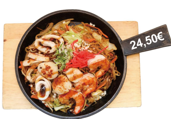
豪華海鮮鉄板焼きそば

Gebratene Nudeln mit Schweinebauchscheiben