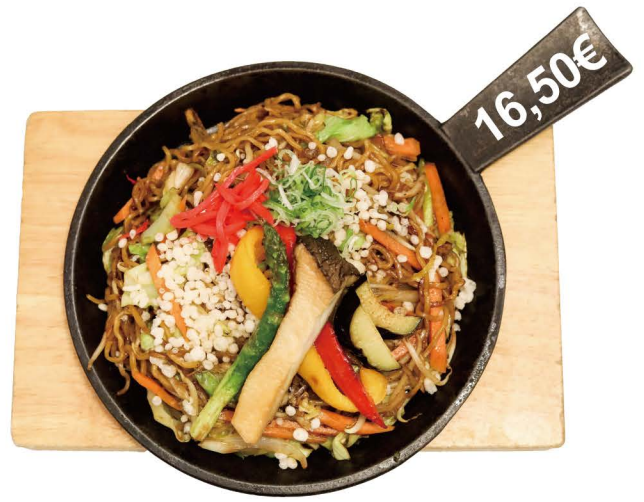
ベジ鉄板焼きそば

Gebratene Nudeln mit Garnelen, Jakobsmuscheln und Tintenfisch