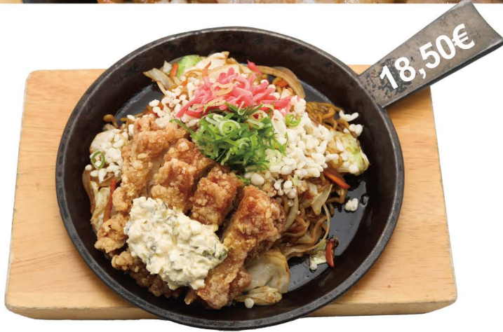
南蛮タルタル焼きそば